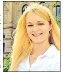
Unter dem Pseudonym Lemonbits veröffentlicht die Wolfenbüttelerin ihren ersten Roman.

„Sue“ in die Quere kommt und dem Karma den Job wegzunehmen scheint. Das nimmt das Karma persönlich und es kürt Sue zum Bösewicht. Das Taschenbuch ist für 9,99 Euro und das eBook für derzeit reduzierte 99 Cent bei Amazon erhältlich. Lemonbits bietet unter lemonbits.de/fan-paket außerdem ein besonderes Paket an. Für 24,95 Euro erhält der Leser unter anderem ein Taschenbuch mit persönlicher Widmung und sechs persönliche Postkarten-Botschaften. Weitere Infos zu L emonbits und „Karma und Sue“ finden Interessierte im Blog lemonbits.de. Den Buchtrailer findet man unter lemonbits.de/sue-trailer und lemonbits.de/karma-trailer.